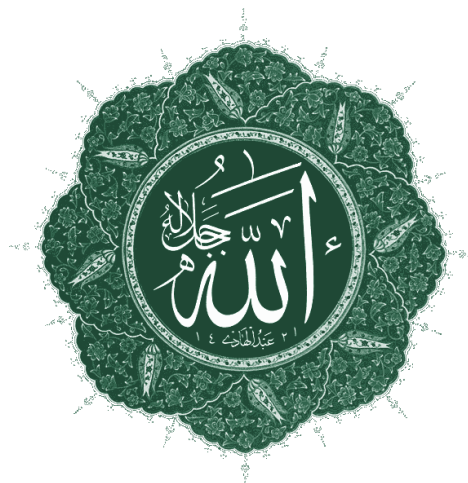
Fig. 3- Allah - reprezentare în alfabetul arab